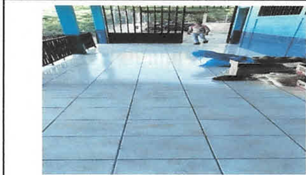
Foto 2: Colocación de Piso terminada en una aula y corredor del establecimiento.