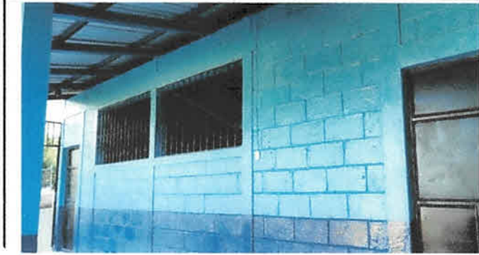
Foto1: Aplicación de pintura de aceite en todo el centro educativo.